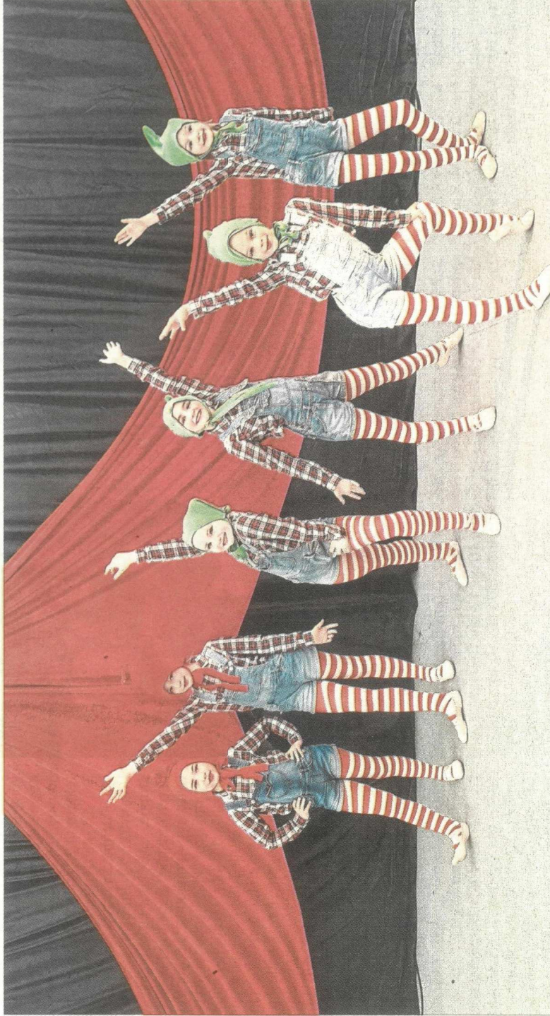
Herzerfrischend präsentieren sich die „Herzenstüre“ beim Landesfinale des DAK-Dance-Contests am 20. Juni.