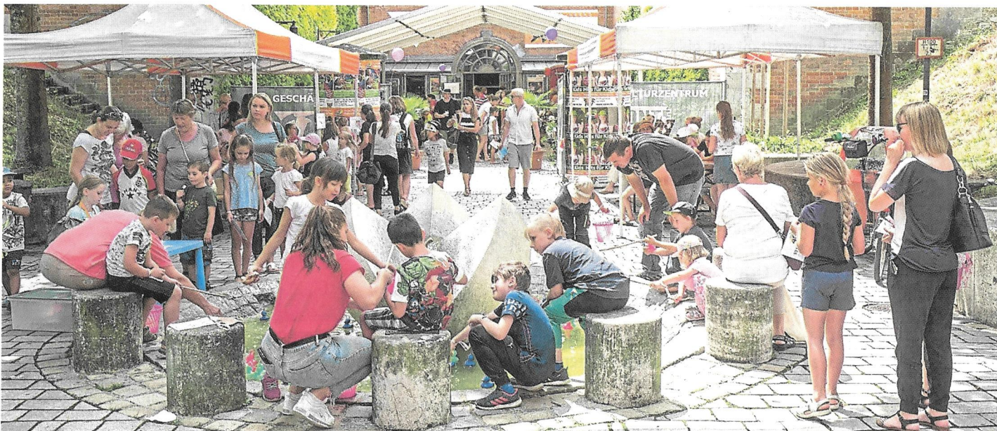
Rund um die Fronte 79 findet vom 31. Juli bis 4. August eine große Sommer-Sause statt.

Der Ferienpass sorgt wieder für großen Sommerspaß bei den Kleinen